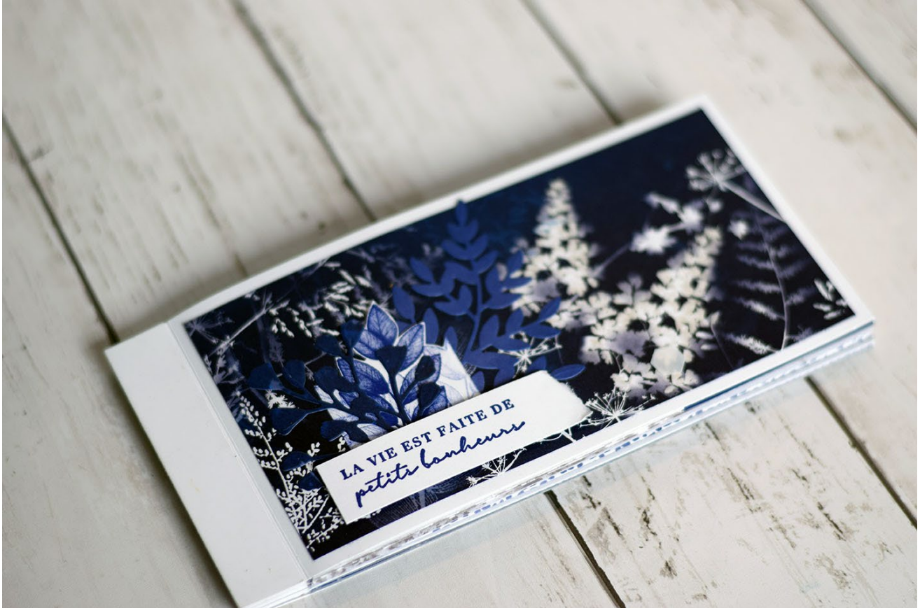
Album pli origami

Le kit de ce projet est composé : des feuilles de la collection « Impressions solaires » et de papier uni (blanc et ardoise bourgeoise).