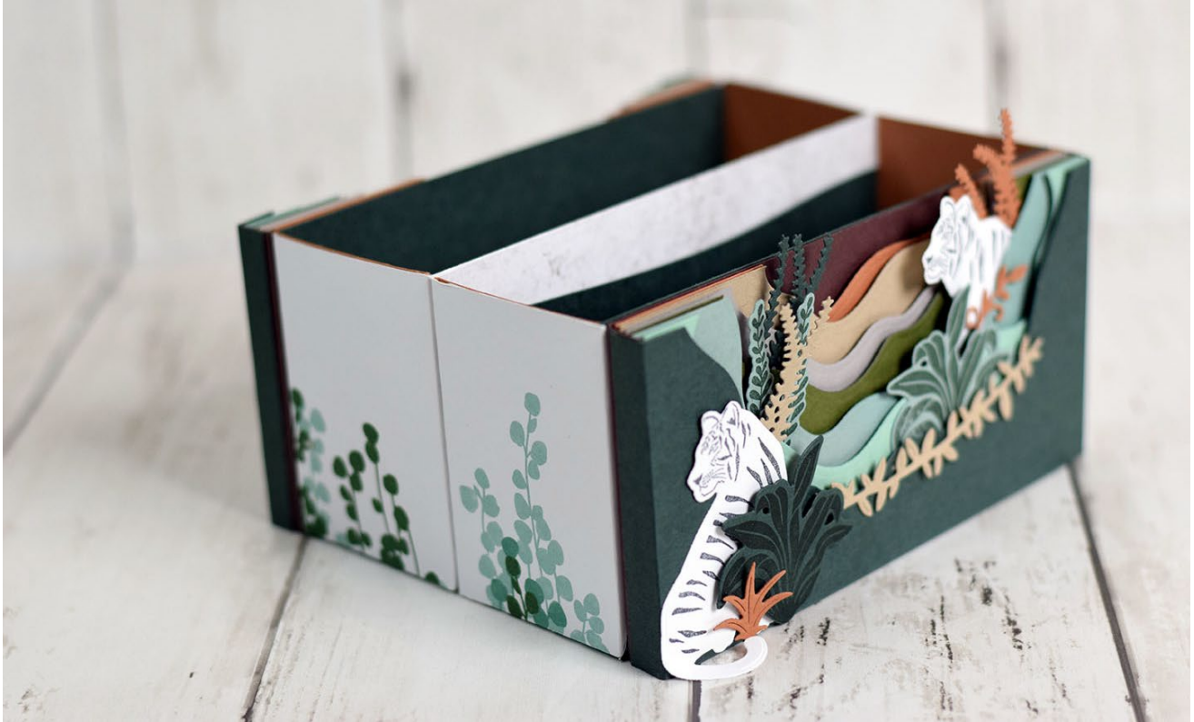
Une boîte diorama

Pour créer ce projet, vous aurez besoin : des poinçons diorama de Stampin'up , d'un coupe papier, d'un plioir, d'adhésif de votre choix (colle ou scotch double face) et de quoi décorer (tampon, poinçon).